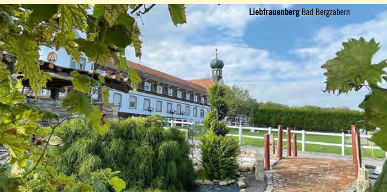
Liebfrauenberg Bad Bergzabern

18:00 Uhr ROSENWOCHEN - Krimilesung mit Gina Greifenstein - Details siehe Seite 42