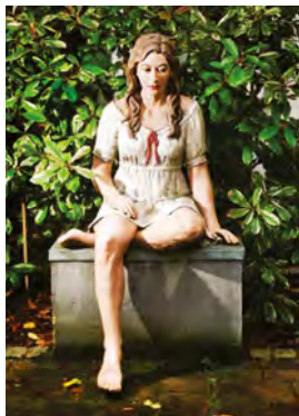
Foto: Skulptur von Gabriele Köbler „Marleen“ - sitzende Figur lebensgroß 2023 / Feinbeton / Auflage 5 Mehr Infos unter www.gabriele-koebler.de

Weitere Informationen finden Sie unter www.schulhaus-schweigen.com