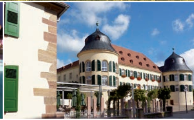
Romantik in der Altstadt