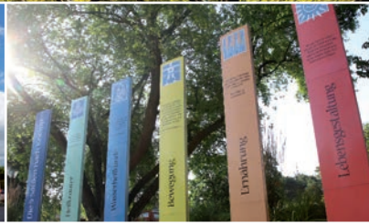
Frische auf Kneipps Spuren

Diese Kurstadt im Süden tut Leib und Seele gut. Denn sie bietet ein breites und modernes Kur- und Wellnessangebot, das jetzt noch einmal attraktiver geworden ist. Zugleich sind Sie in diesem Staatsbad Gast in einer der schönsten Urlaubslandschaften Deutschlands. Denn Sie sind mitten im Weinland der Südlichen Weinstrasse , unmittelbar am Rande des Pfälzerwaldes . Und auch das nördliche Elsass ist ganz nah. Hier empfängt Sie nicht nur das milde Klima des Südens, hier atmen Sie nicht nur die frisch aromatisierte Luft des Pfälzerwaldes. Hier erwartet Sie die Südpfalz Therme mit dem Heilwasser aus der Tiefe. In diesem Kneipp-Heilbad sind die fünf Säulen der Gesundheit aus Pfarrer Kneipps Zeiten aktueller denn je. Hier genießen Sie die Pfälzer Gastlichkeit und eine Weinkultur und Lebensart , die jeder Erholung nur förderlich sein kann. Alles, was Sie zu Ihrer Kur oder Ihrem Urlaub wissen sollten, erfahren Sie bei unserer Tourist-Information. Bis bald im Süden.